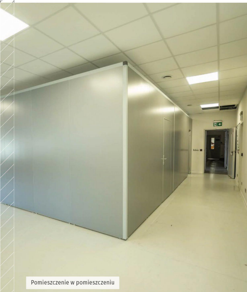
Pomieszczenie w pomieszczeniu